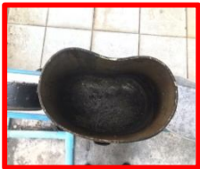
หม้อข้าวสนามที่มีคราบฝังแน่น

เนื้อหา : หม้อหุงข้าวสนามเป็นอุปกรณ์อย่างหนึ่ง ซึ่ง นนร.จะต้องในการฝึกภาคสนามฯ โดยการฝึกฯ แต่ละครั้งจะใช้เวลาดำเนินงานนาน หม้อหุงข้าวสนามมักมีคราบสกปรกต่าง ๆ เช่น รอยไหม้ เป็นต้น คราบดังกล่าวจะฝังแน่นอยู่ การทำความสะอาดหม้อข้าว โดยการใช้น้ำยาล้างจานตามปกติ ไม่สามารถทำให้คราบสกปรกดังกล่าวหลุดออกไปได้ ดังนั้นจึงจำเป็นต้องทำความสะอาดแบบพิเศษ